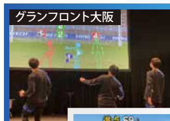
グランフロント大阪